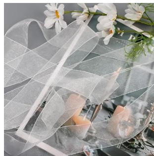
オーガンジーリボン