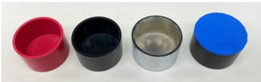
図 3 持ち込みワークピース