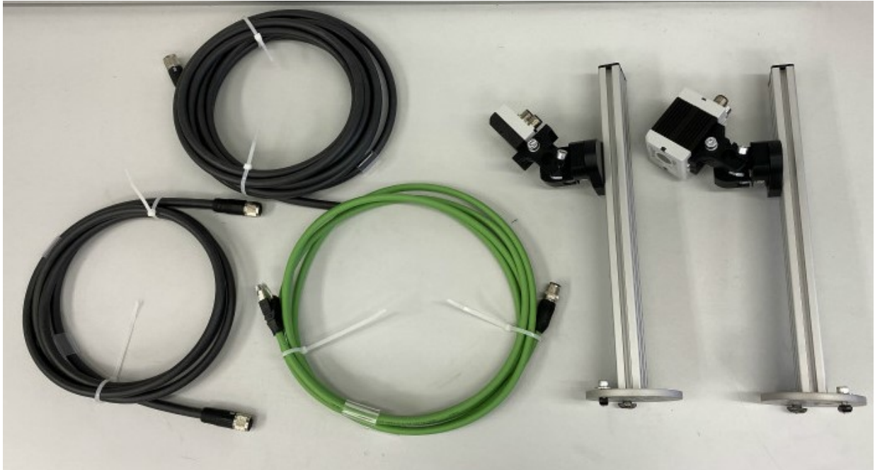
図 2 ビジョンモジュールの持ち込み状態