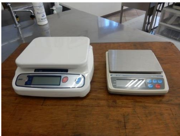
【電子ばかり(左)、薬品ばかり(右)】