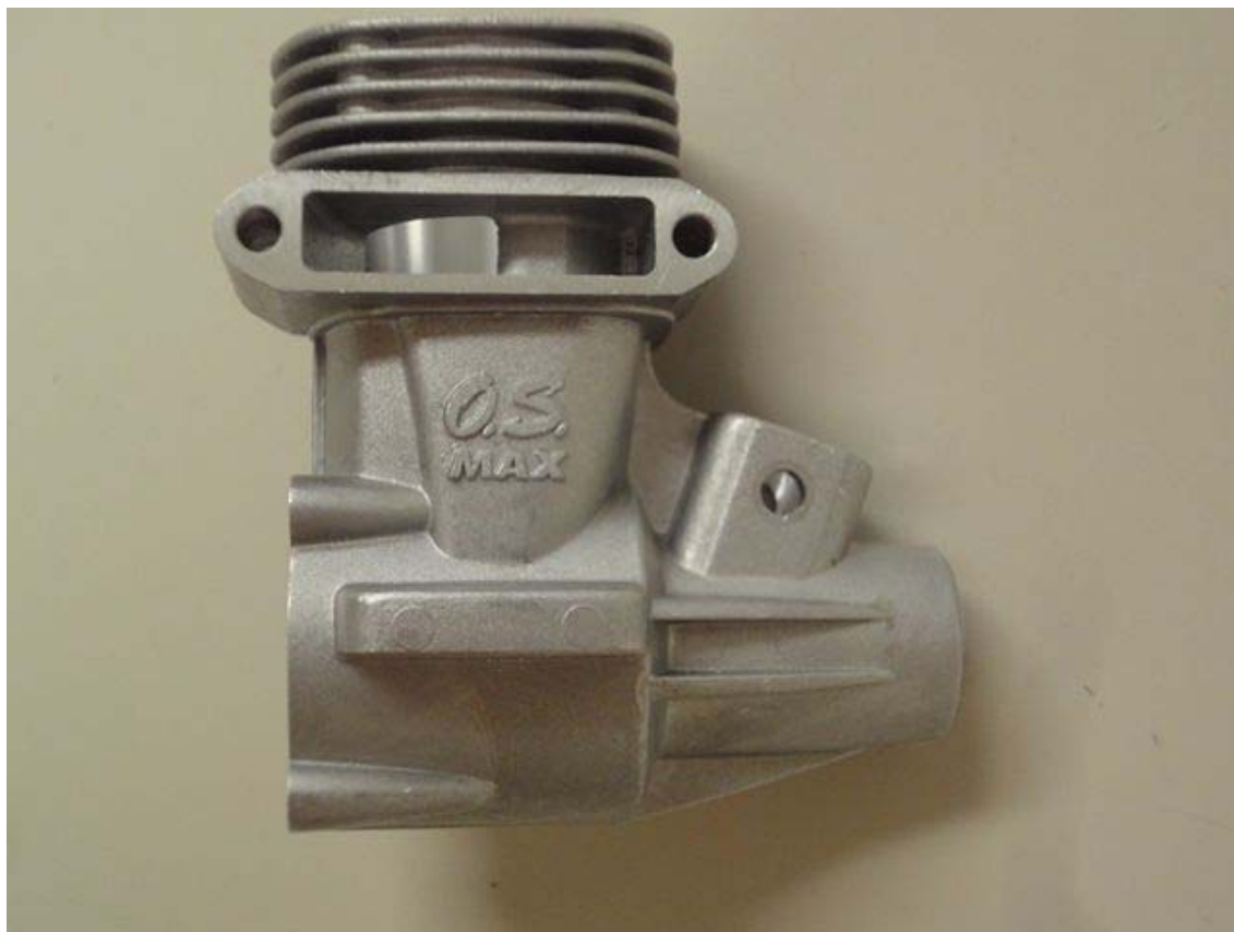
【写真】 前回大会の実物モデル

下の【写真】に示す実物モデルが与えられ、この寸法形状を測定具によって測定しながらスケッチし、それを 3D-CAD システムによって 3 次元モデルで表現するとともに、2 次元の製作図面を作成する。