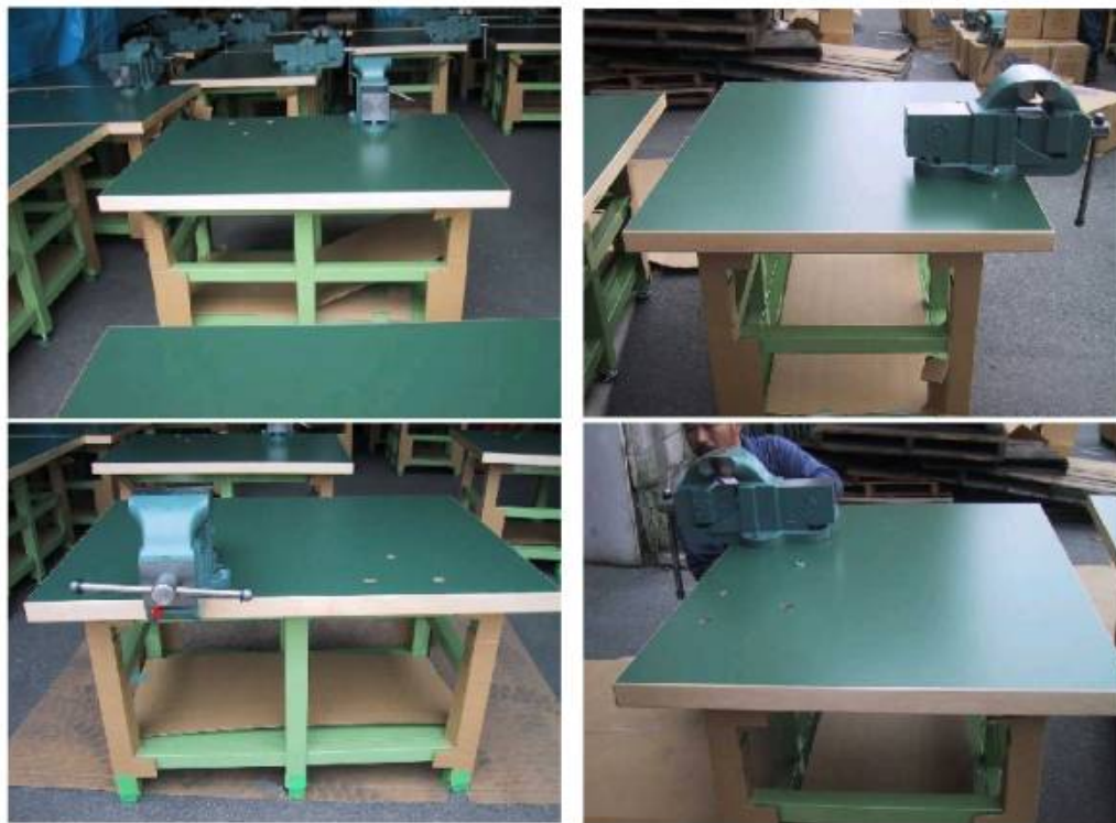
《技能グランプリ 作業台》