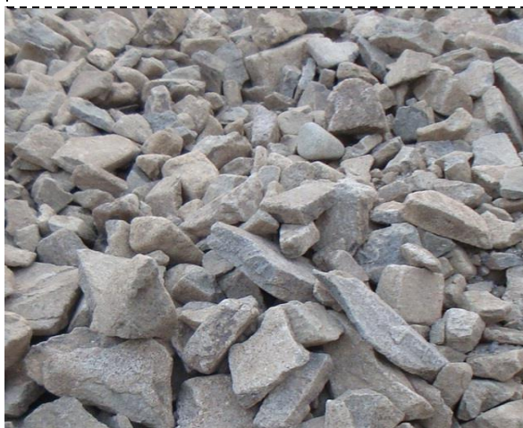
生野丹波石（庭石） 参考写真