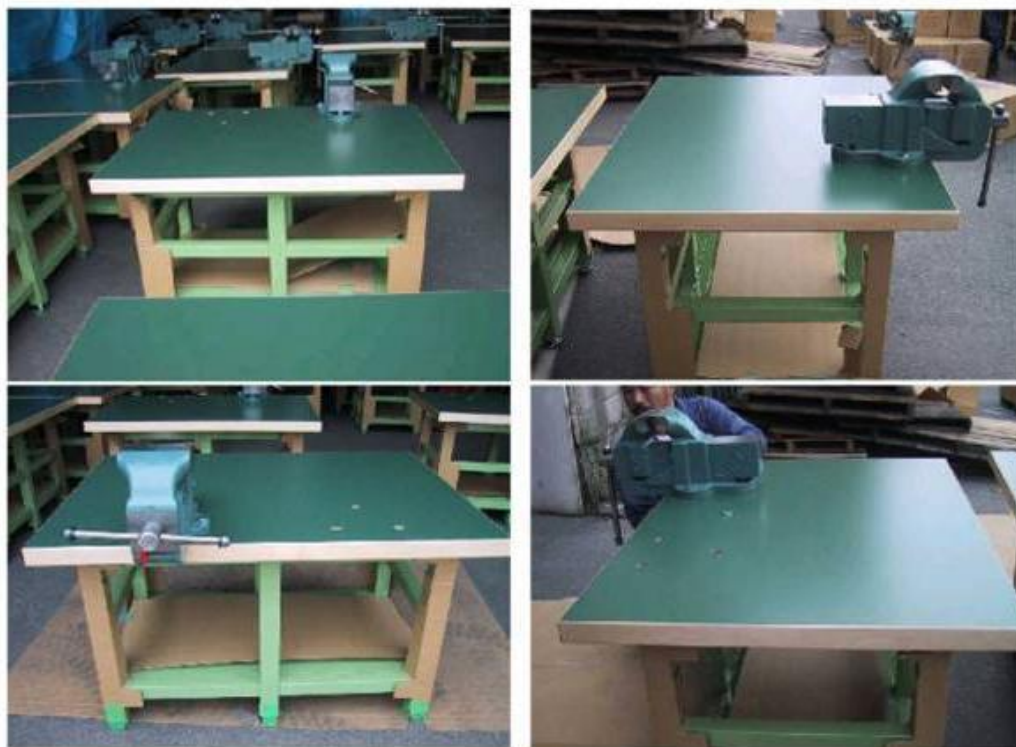
【技能グランプリ 作業台】