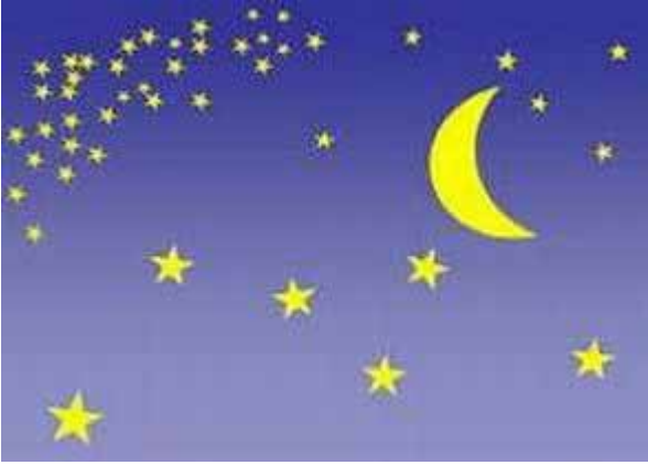
画像 R. jpg